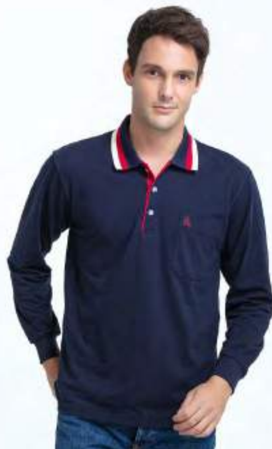
快乾棉長袖 POLO 衫 售價 $1200