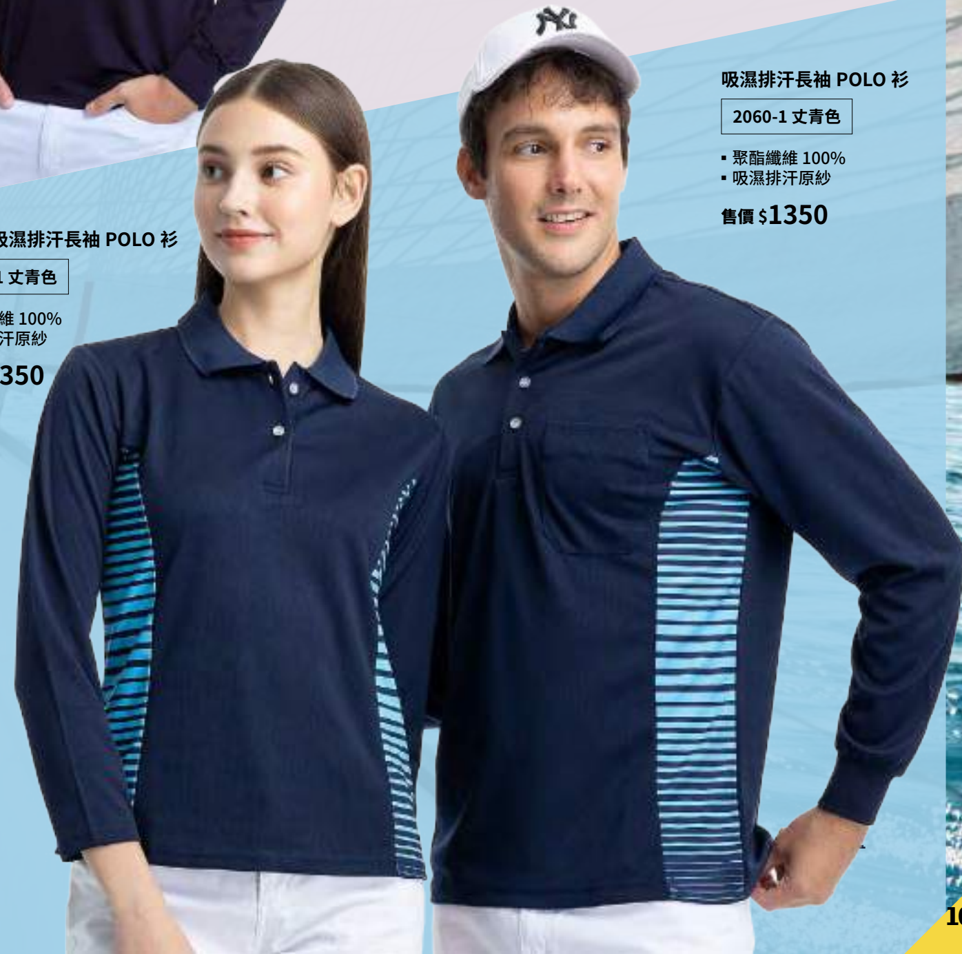
吸濕排汗長袖 POLO 衫