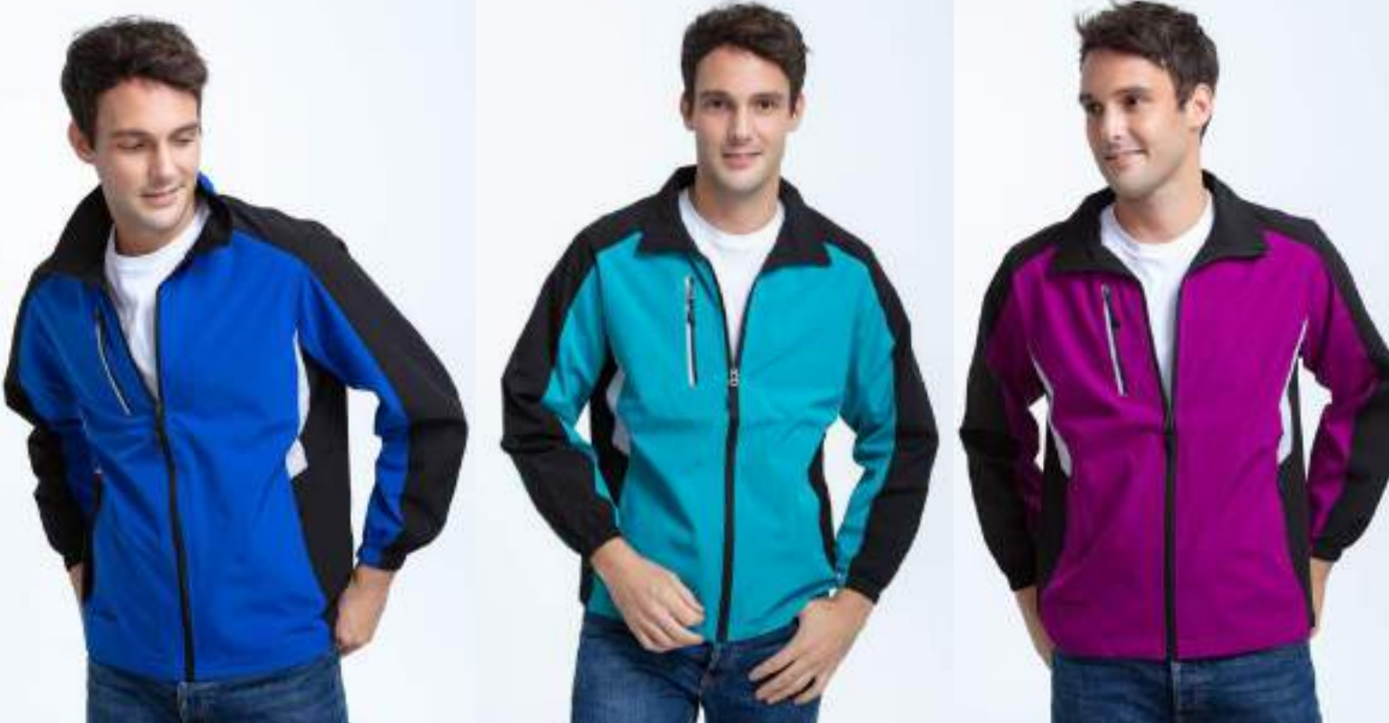
超彈力網裡外套 售價 $1950