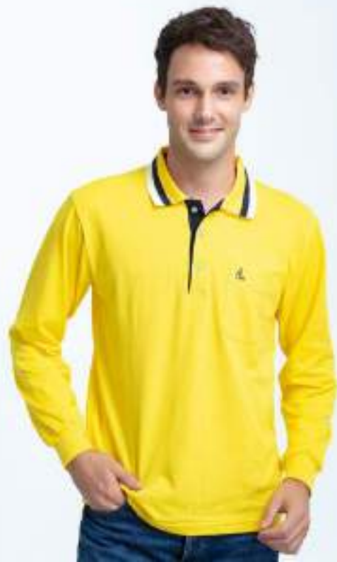
快乾棉長袖 POLO 衫 售價 $1200