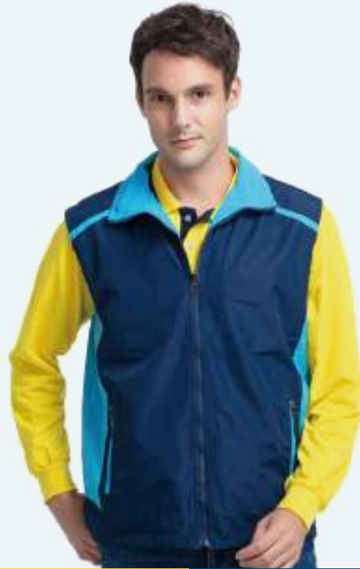
防水透濕雙面穿搖粒背心 | 可加 4128-1 外套