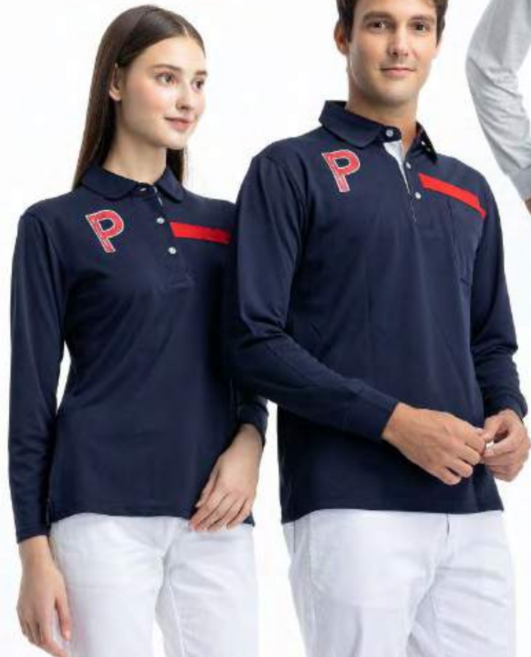
女款 - 吸濕排汗長袖 POLO 衫