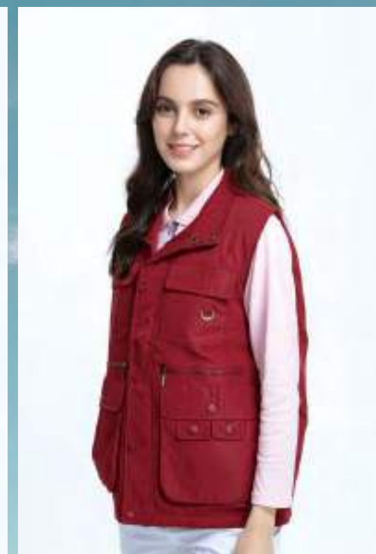
多口袋背心 售價 $2250