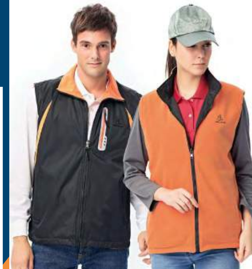
雙面穿搖粒背心 | 可加外套 售價 $1450