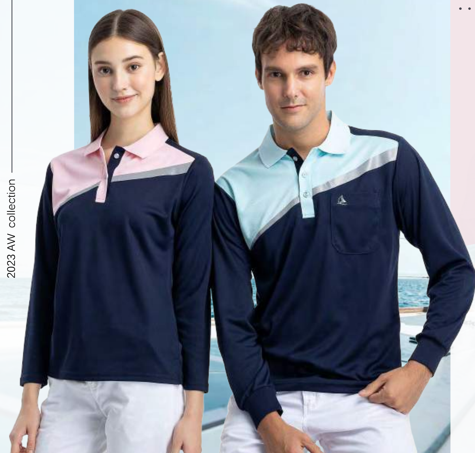
女款 - 吸濕排汗長袖 POLO 衫 售價 $1650