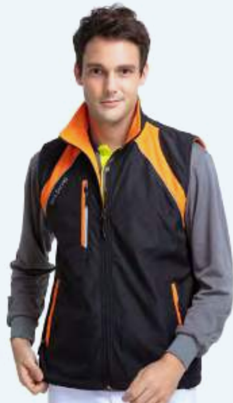
雙面穿搖粒背心 | 可加外套 售價 $1600