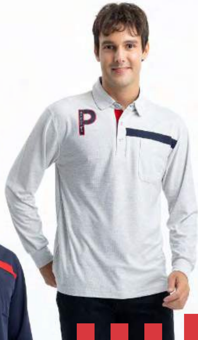
吸濕排汗長袖 POLO 衫