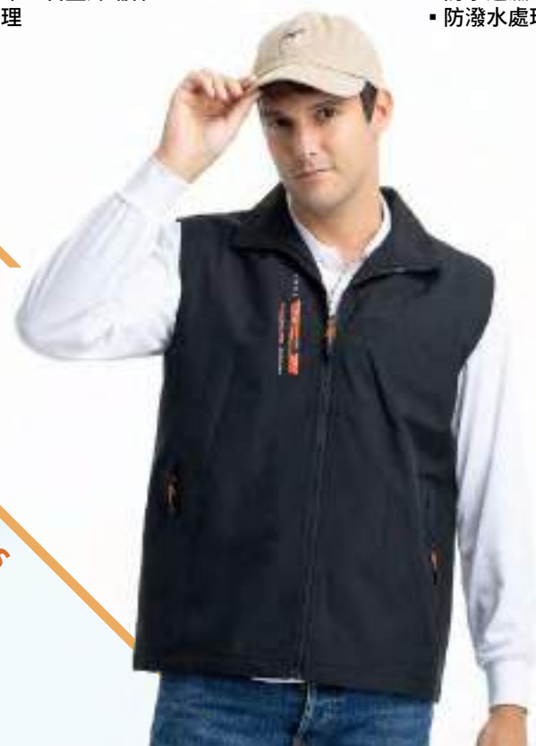
石墨烯鋪棉機能背心 | 可加 4271-1 外套