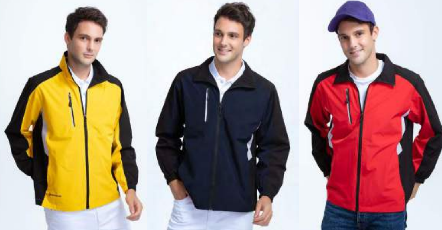
超彈力網裡外套 售價 $1950