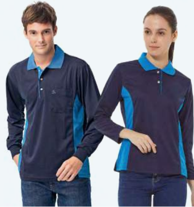
女款 - 吸濕排汗長袖 POLO 衫