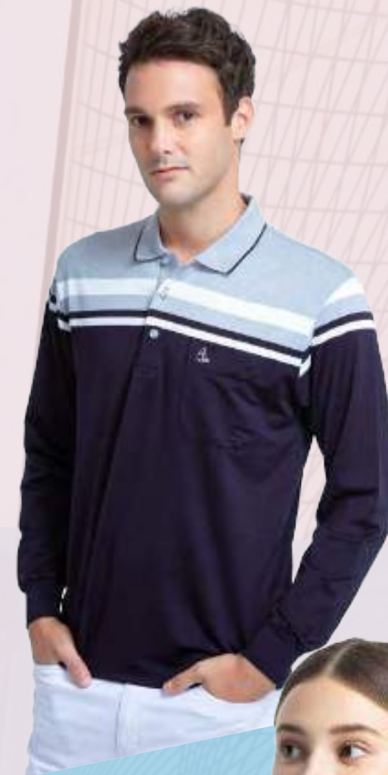
吸濕排汗彈性長袖 POLO 衫

• • • • • • • • • • • • • • • • • • • • •