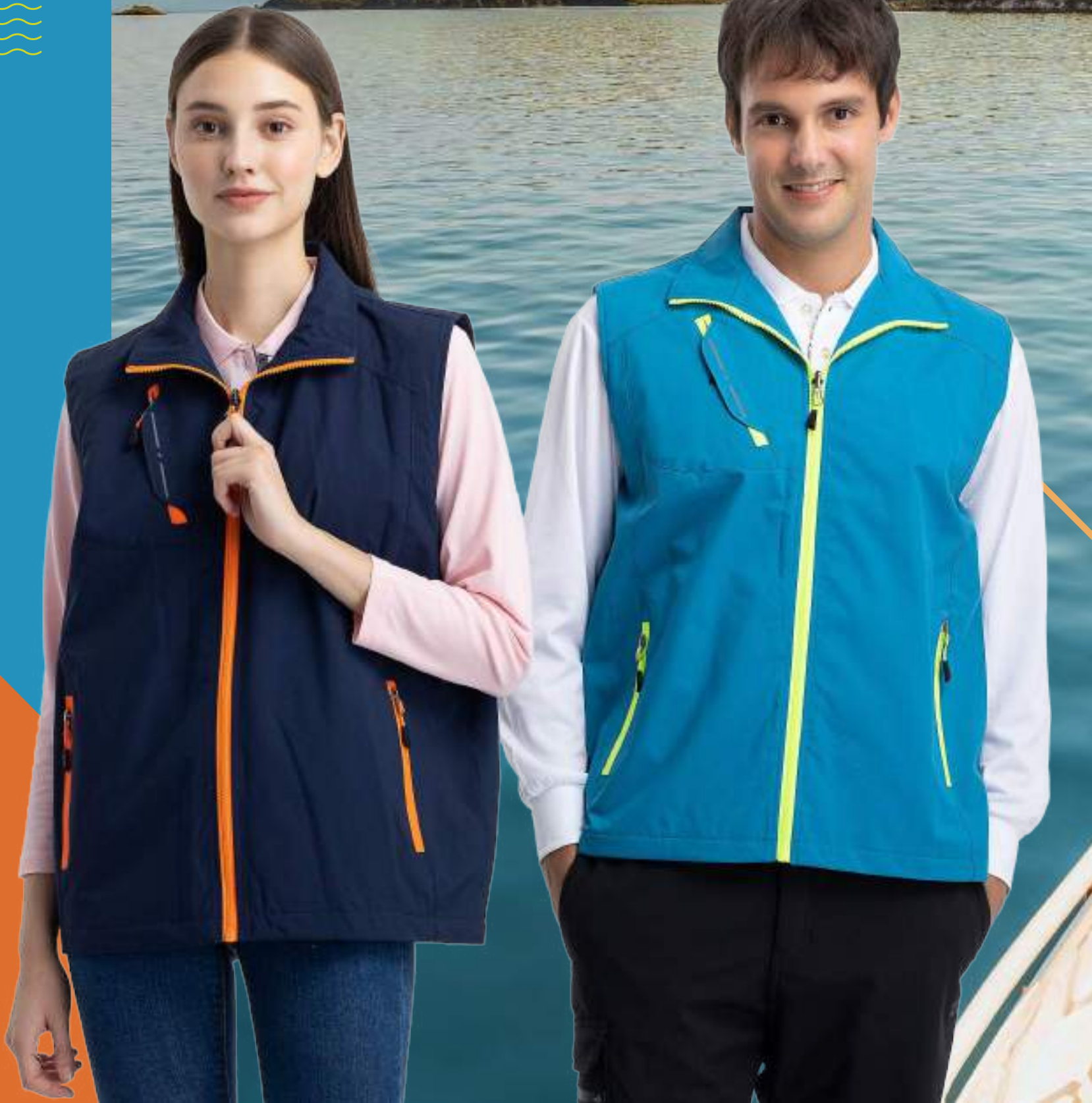
防水透濕鋪棉背心 | 可加 4275-2 外套