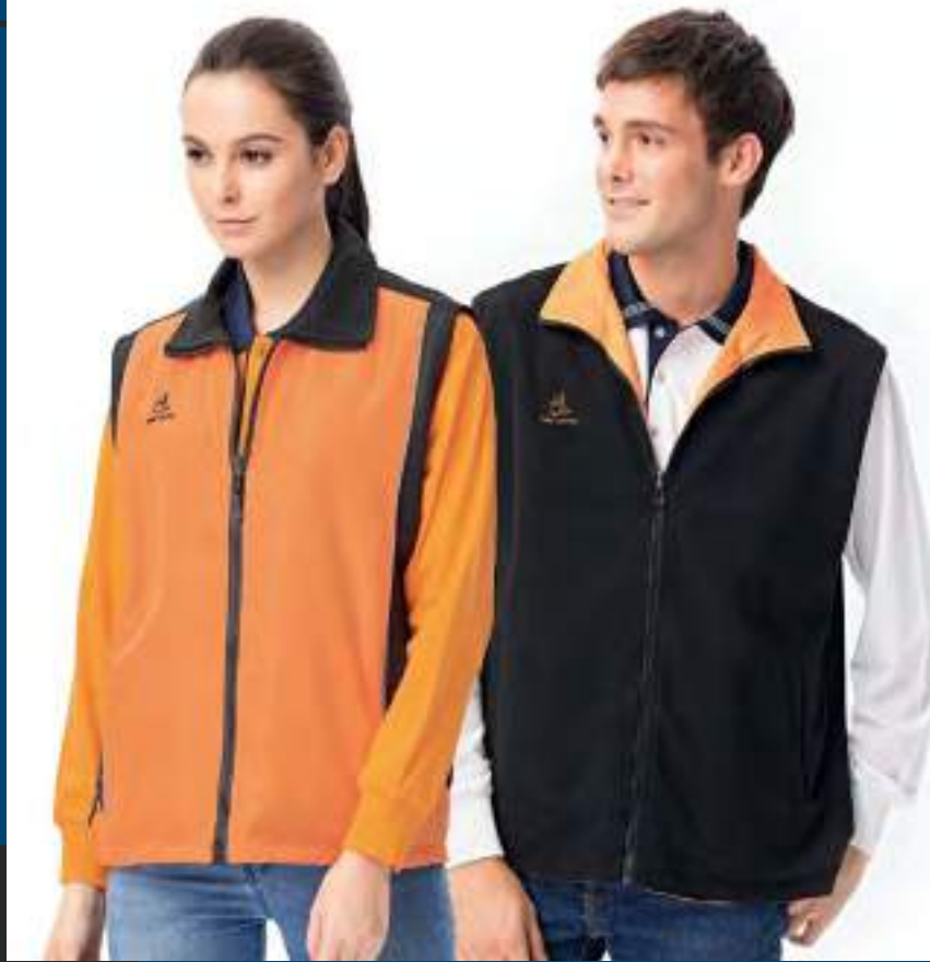
反光雙面穿搖粒背心 | 可加外套 售價 $1450