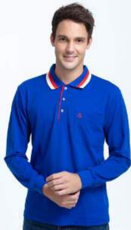
快乾棉長袖 POLO 衫 售價 $1200