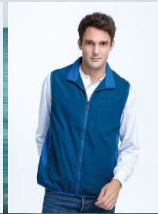
複合布搖粒背心 售價 $1650