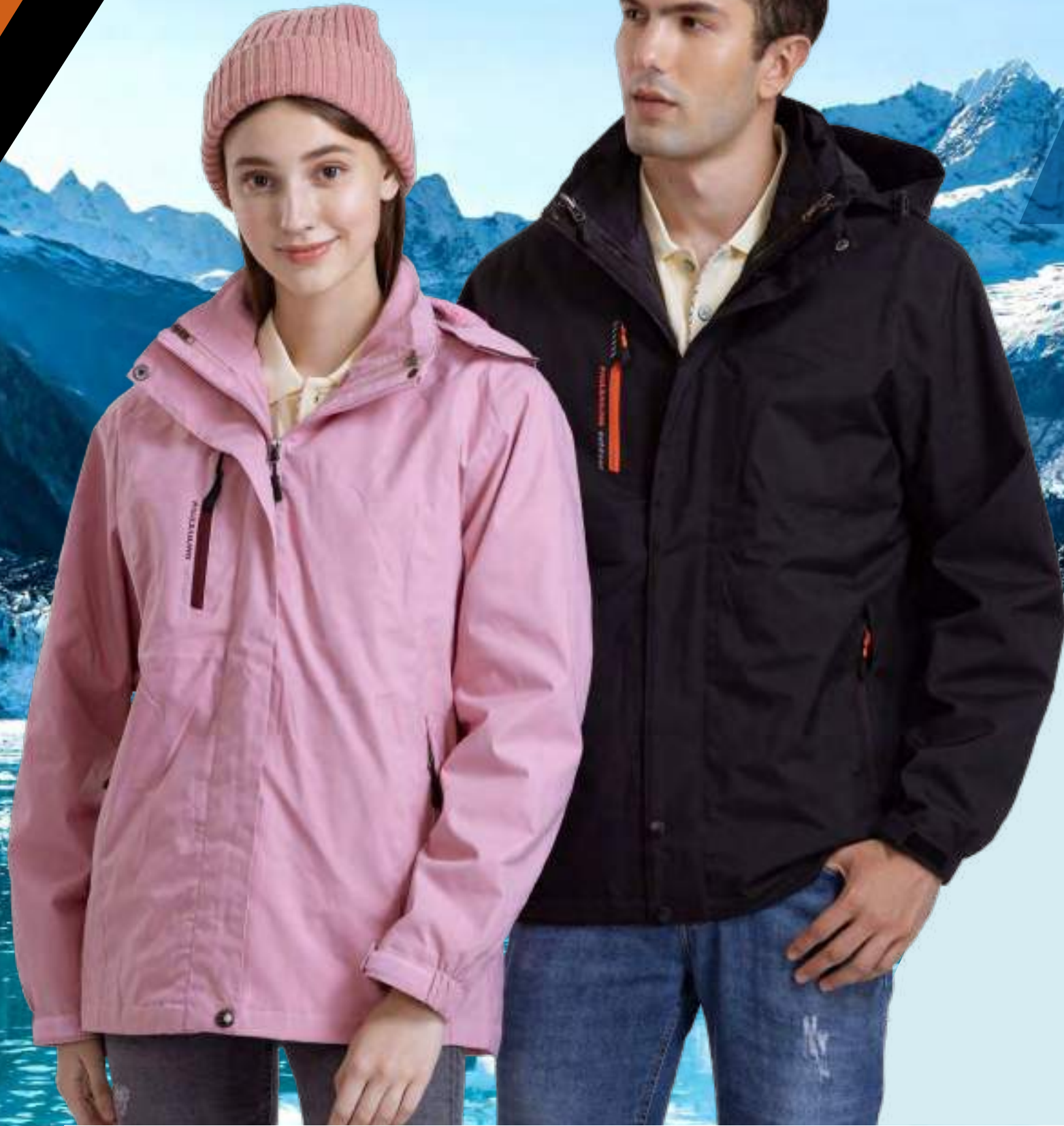
女款 - 石墨烯鋪棉機能外套 | 帽子可拆 | 可加背心