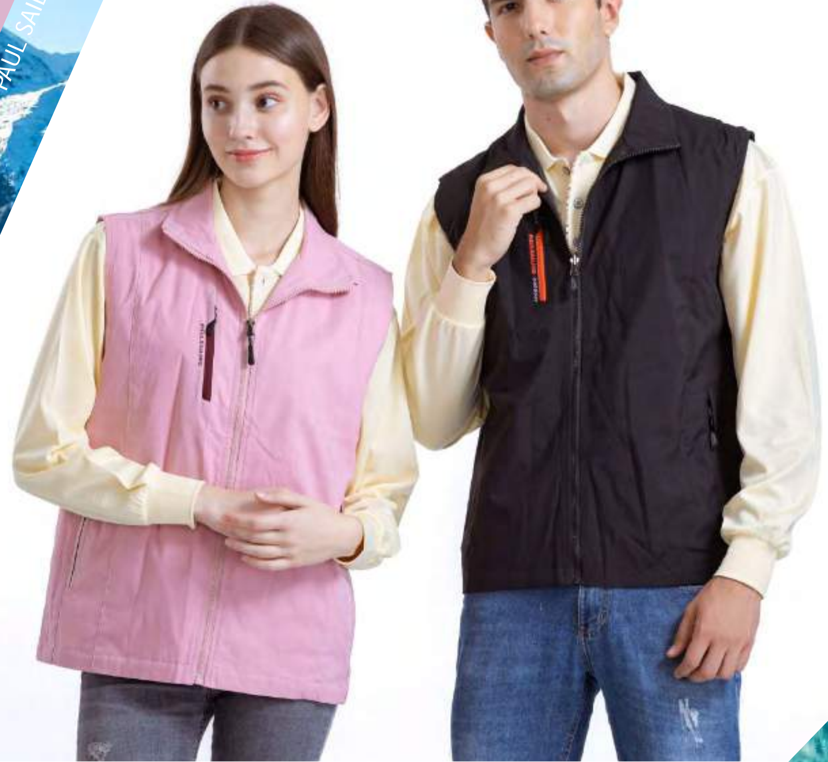
女款 - 石墨烯鋪棉機能背心 | 可加外套