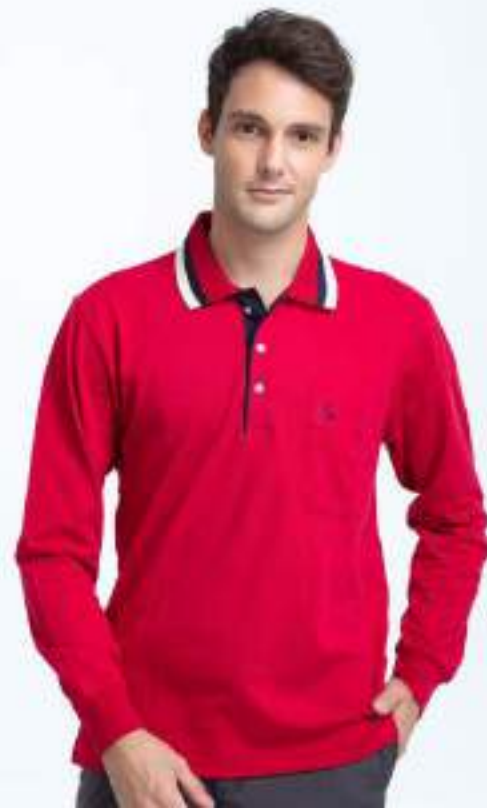
快乾棉長袖 POLO 衫 售價 $1200