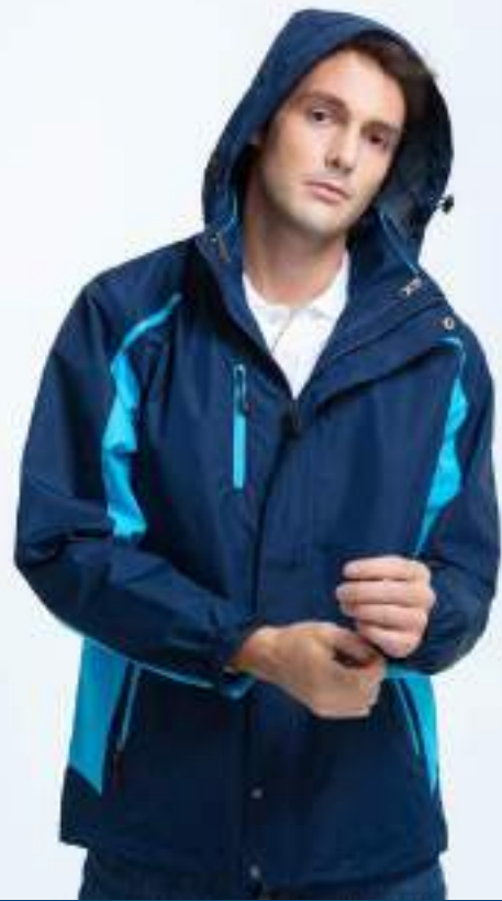
防水透濕絨裡風衣外套 | 帽子可折 | 可加背心