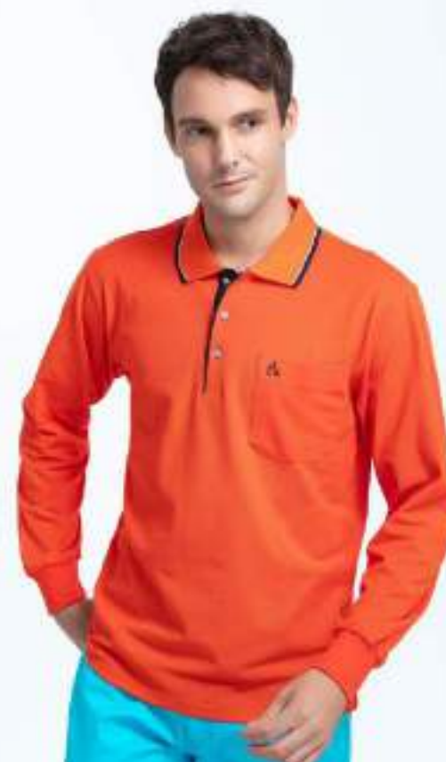
快乾棉長袖 POLO 衫