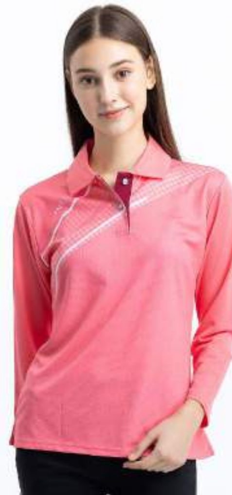
女款 - 吸濕排汗長袖 POLO 衫