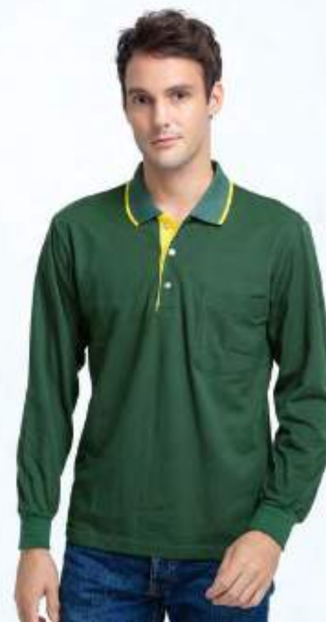
快乾棉長袖 POLO 衫 售價 $1200