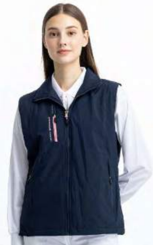
女款 - 石墨烯鋪棉機能背心 | 可加 4272-2 外套