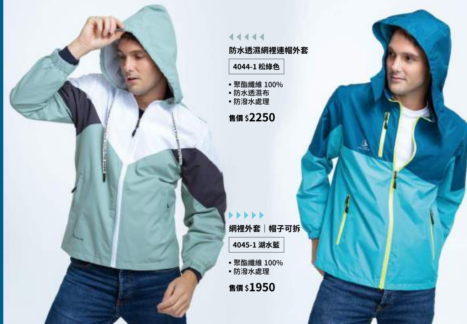
防水透濕網裡連帽外套