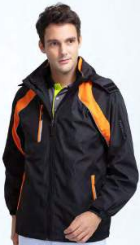
風衣外套 | 帽子可折 | 可加背心