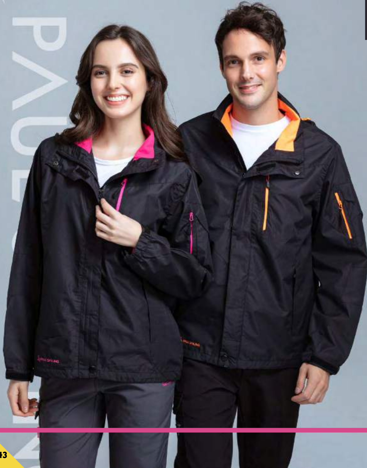
女款 防水透濕網裡機能外套 售價 $2450