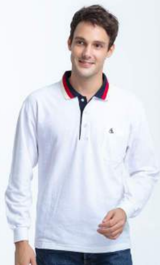
快乾棉長袖 POLO 衫 售價 $1200