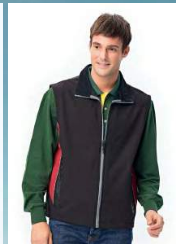
防水透濕軟殼機能背心 售價 $1950