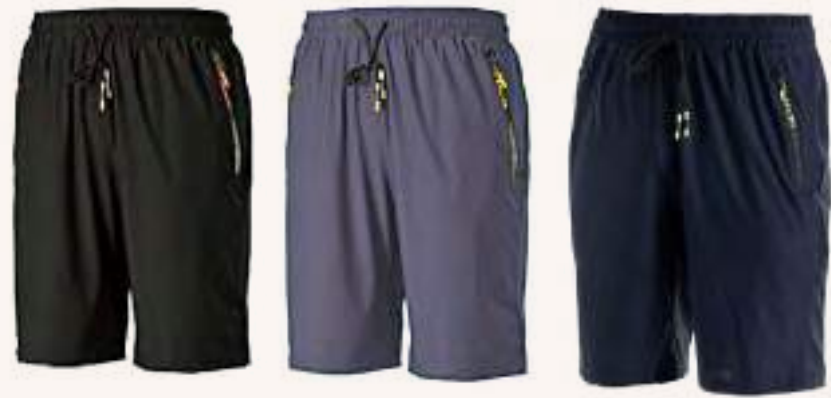
超彈力吸濕排汗五分褲 售價 $1180