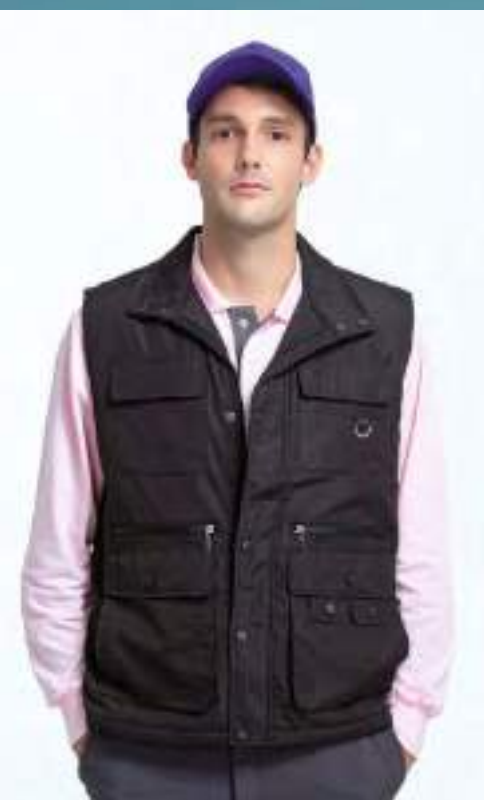
多口袋背心 售價 $2250