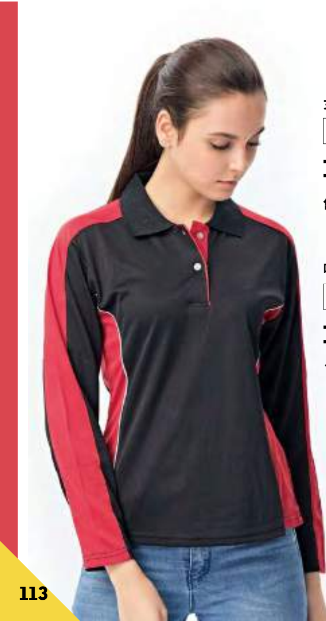
女款 - 吸濕排汗長袖 POLO 衫