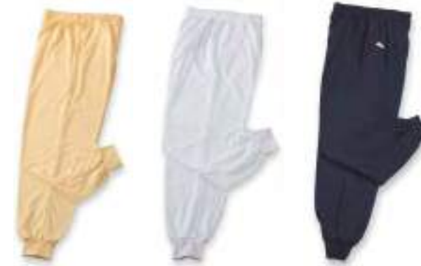
TC 小絨布長褲 售價 $900