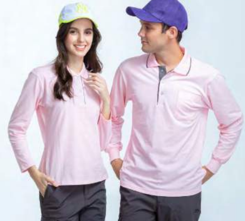
女款-快乾棉長袖 POLO 衫 售價 $1200