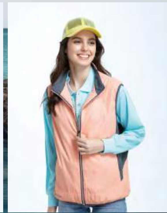
複合布搖粒背心 售價 $1650