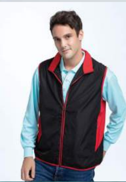
複合布搖粒背心 售價 $1650