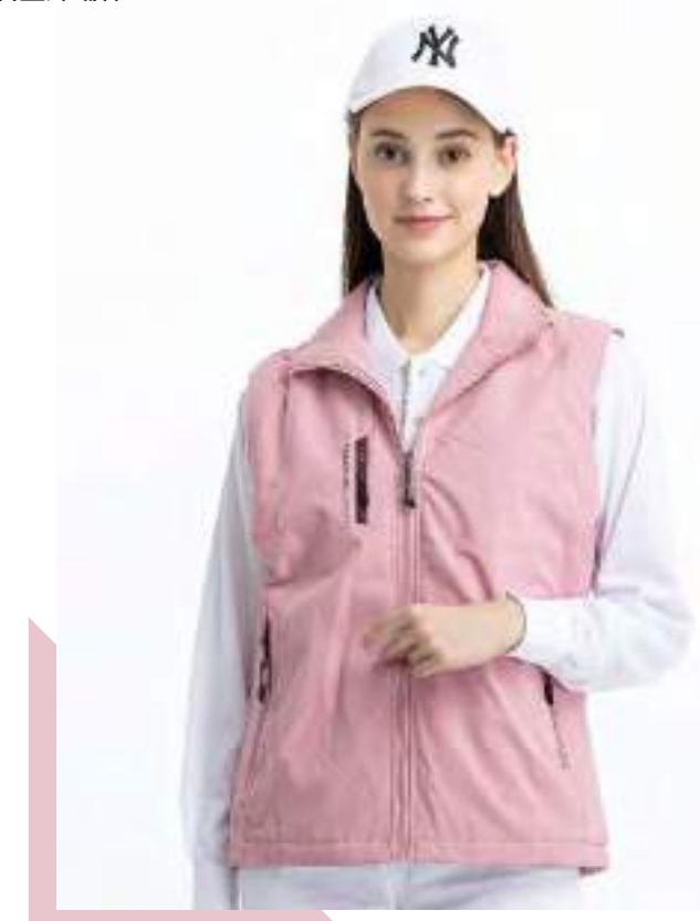
女款 - 石墨烯鋪棉機能背心 | 可加 4272-1 外套