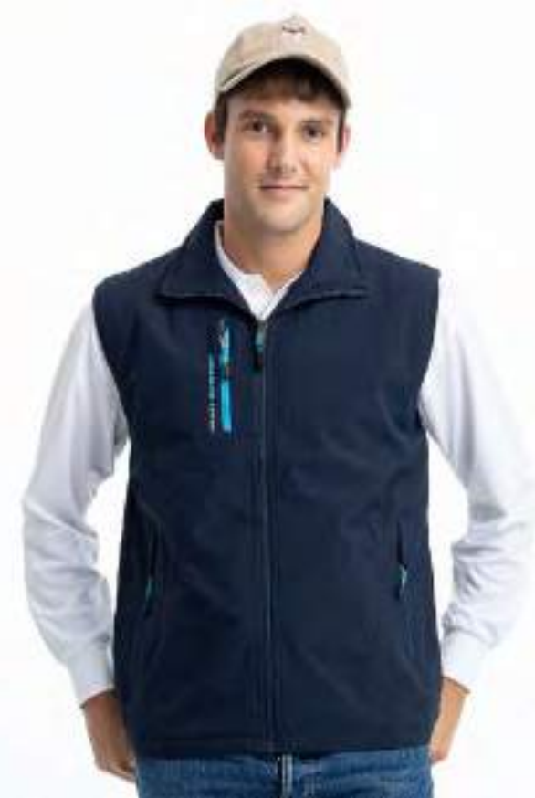
石墨烯鋪棉機能背心 | 可加 4271-2 外套